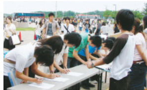
写真1 総会出席の呼びかけ

最後になりましたが、卒業生の方々へのメッセージです。皆さんは、学生時代に経験した様々なことを今、実社会において生かしているはず。それはすばらしいことだと思います。学生時代と比べて、テンポも速く責任も大きいです。結果もはっきり分かり、やりがいも大きいのではないですか!? 時には頑張りすぎて疲れてしまうこともあるでしょうが、しっかり体調を整え、その時々のお会いや経験に有意義さと喜びを見出してほしいと願っています。そして時間をつくって、母校に遊びに来てください。学友会と母校の進化をどうか応援してください。