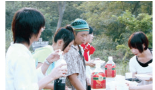
写真2 伍桃祭実行委員会とのBBQ交流